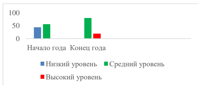
Диаграмма физического развития дошкольников

Анализ проведённого мониторинга, свидетельствует о качественном приросте физического развития дошкольников. Дети овладели строевой подготовкой, научились правильно выполнять прыжки с места, уверенно владеют мячом.